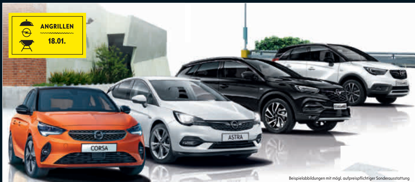
Beispielabbildungen mit mögl. aufpreispflichtiger Sonderausstattung