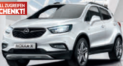
Beispielabbildung mit mögl. aufpreispflichtiger Sonderausstattung