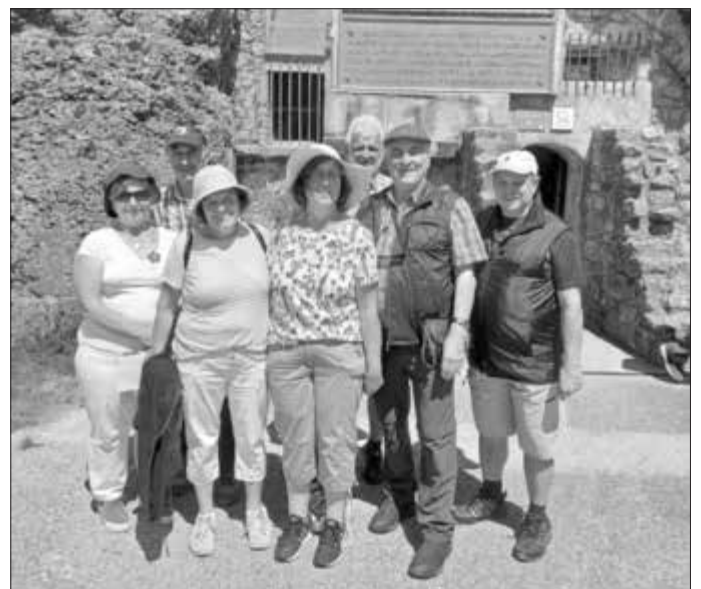
Reisegruppe vor Fort Doumount