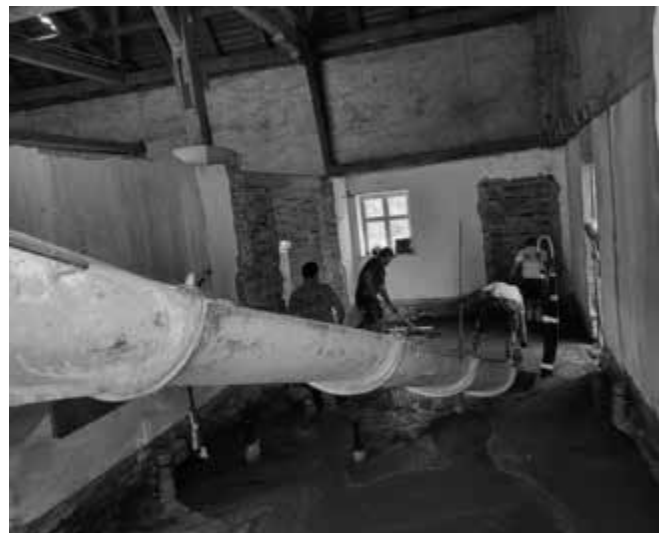
Edgar Kalb, 1. Bürgermeister

Am 4.7.2023 konnten sich auch die Mitglieder des Bau-, Umwelt- und Energieausschusses selbst ein Bild von den vielen Details im Stadel machen. Ein Großteil der Wasser-, Abwasser- und Elektroröhre ist eingebracht und eine erste Sauberkeitsschicht wurde betoniert.