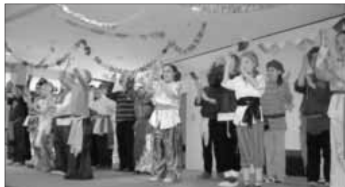
Bunt kostümiert und stimmungsgewaltig präsentierte die Klasse 4a ihr Stück „Sindbad, der Abenteurer“.