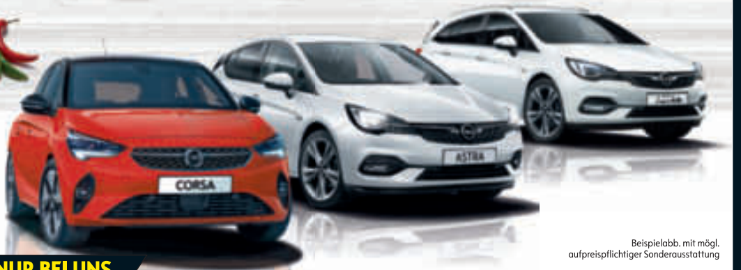
Beispielabb. mit mögl. aufpreispflichtiger Sonderausstattung