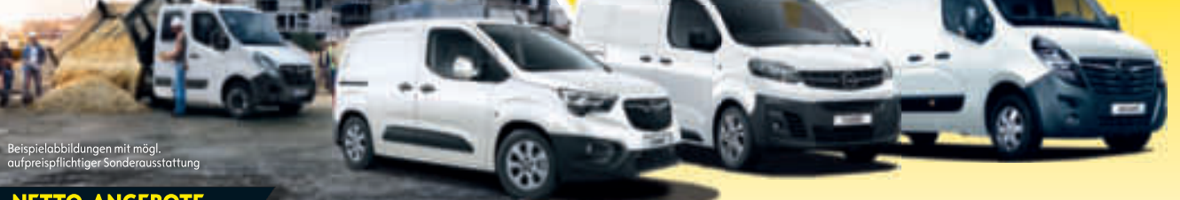
Beispielabbildungen mit mögl. aufpreispflichtiger Sonderausstattung

ANGEBOTE NUR FÜR GEWERBETREIBENDE ALLE ANGEBOTE ZZGL. GÜLTIGER, GESETZLICHER MEHRWERTSTEUER