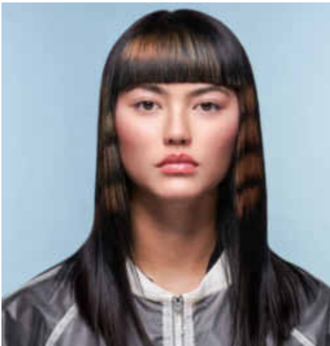
Der handwerklich ausgefeilte Stufen-Cut erinnert mit der knapp über den Augenbrauen endenden und horizontal kompakt geschnittenen Ponypartie an die moderne Kleopatra.

Lange Haare zeigen sich nun stufig. Mit der knapp über den Augenbrauen endenden und horizontal geschnittenen Ponypartie erinnert etwa der handwerklich ausgefeilte Stufenschnitt bei den Kreativen des ZV an eine moderne Kleopatra. Für einen zusätzlichen Hingucker sorgt Patchwork-Technik in Bronzetönen auf der Haaroberfläche. Sehr weich und feminin wirkt die Stylingvariante mit glattem Pony zu gecurlten Längen. Auch wilde Locken fehlen in dieser Saison nicht, zum Beispiel als asymmetrischer Locken-Style in Szene gesetzt. Sportlich und äußerst lässig erscheint der schulterlange Basis-Schnitt als High Ponytail im Messy-Look. Für das richtige Feintuning können einzelne Haare im Konturenbereich ausgearbeitet und betont werden.