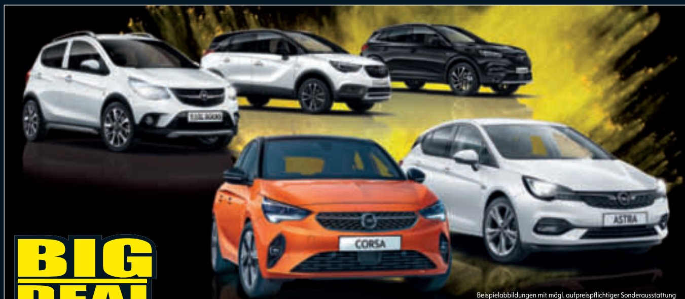
Beispielabbildungen mit mögl. aufpreispflichtiger Sonderausstattung