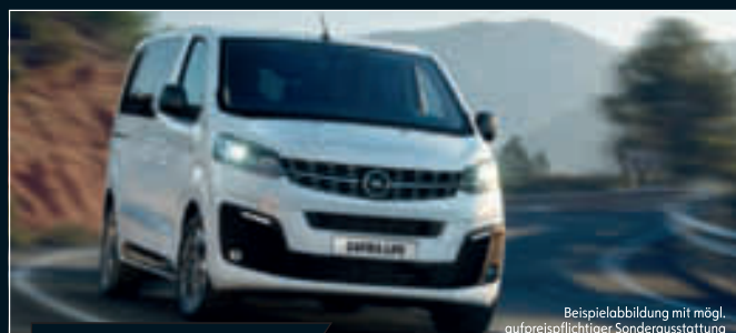
Beispielabbildung mit mögl. aufpreispflichtiger Sonderausstattung

Königsbrunn Haunstetter Str. 57 Tel. (08231) 86033