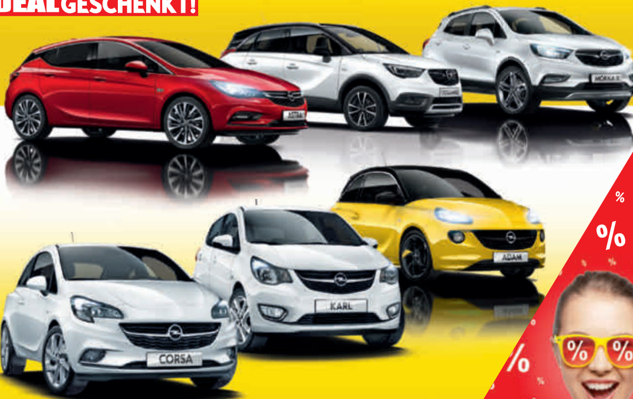
Abb. zeigen Sonderausstattung

BIG DEAL 6 Jahre Garantie 2) 3 Inspektionen 3) GESCHENKT!