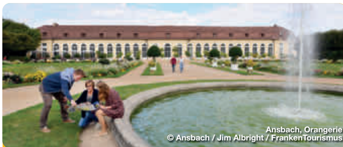
Ansbach, Orangerie