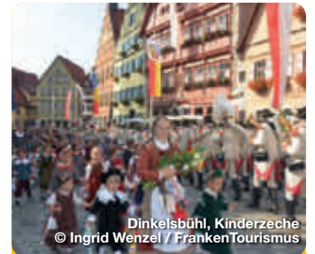
Dinkelsbühl, Kinderzeche