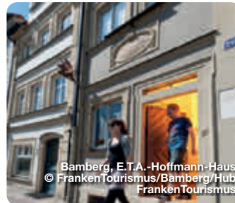
Bamberg, E.T.A.-Hoffmann-Haus