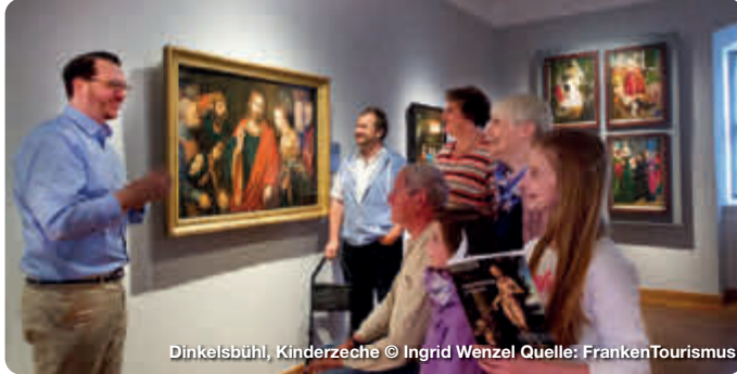
Dinkelsbühl, Kinderzeche

Das TreffpunktDeutschland Team wünscht allen Lesern ein frohes Weihnachtsfest und ein glückliches gesundes neues Jahr. Freuen wir uns auf tolle Ausflüge und Reisen in 2022.