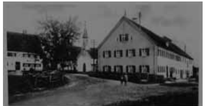
Ortskern von Au um 1900

Zusammen mit Statiker, Zimmermann und Denkmalmant wird das Reparaturkonzept festgelegt.