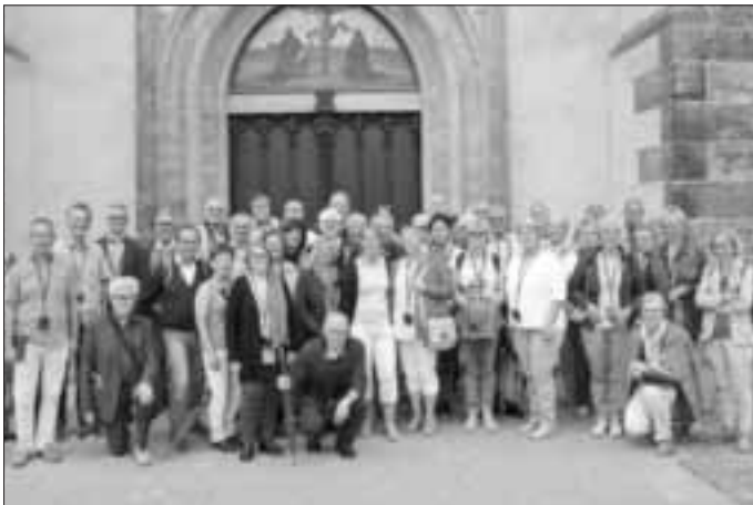
Reisegruppe an der Pforte der Schlosskirche in Wittenberg