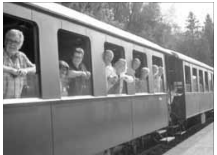
Bestes Wetter, beste Laune auf der Schwäbischen Eisenbahn