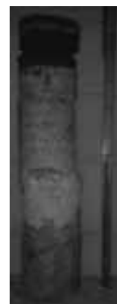
Bohrkern aus Hallenboden