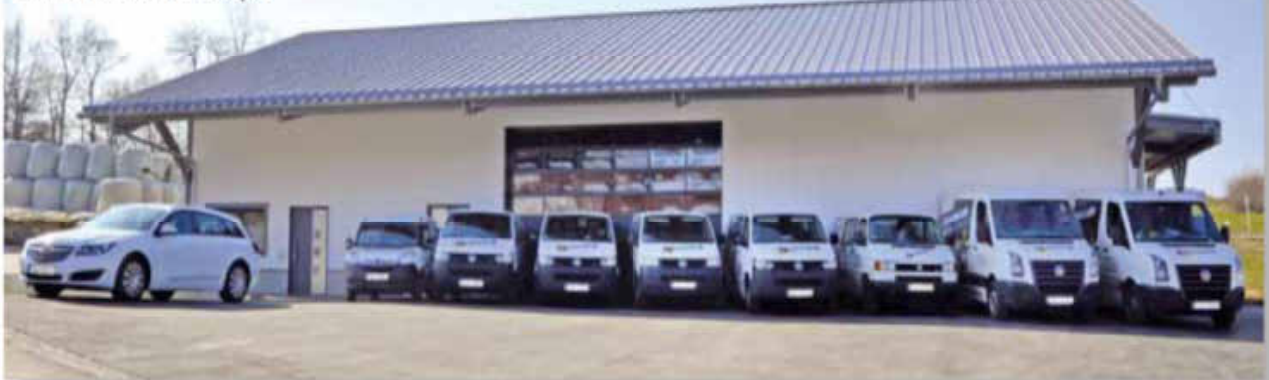
Der neue Firmensitz mit Fuhrpark