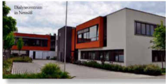
Dialysezentrum in Neusäß