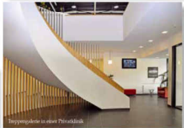
Treppengalerie in einer Privatklinik