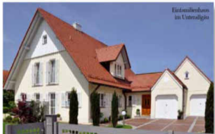
Einfamilienhaus in Unteralting