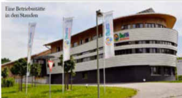
Eine Betriebsstätte in den Stauden