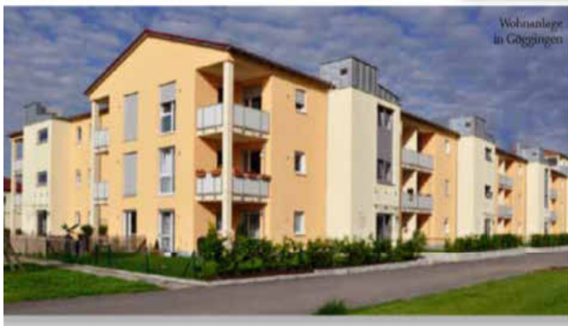
Wohnanlage in Göggingen