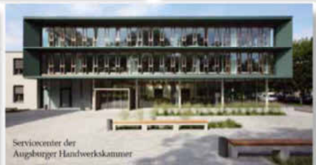
Servicecenter der Augsburger Handwerkskammer

WDVS-Dämmung · Brandschutzbeschichtung · Fußbodenbeschichtung · Restaurierung