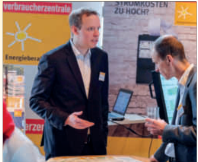
Viele Energieberater und Vertreter aus Politik und der Energiebranche feiern das diesjährige 40-jährige Jubiläum der Energieberatung der Verbraucherzentrale und entdecken das umfangreiche Beratungsangebot.