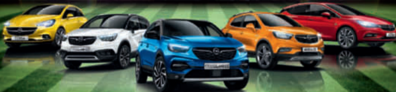
Abb. zeigen Sonderausstattung

6 Jahre Garantie 2) + 3 Inspektionen 3) GESCHENKT