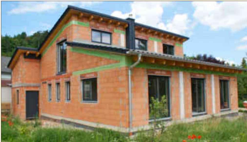
Ein Haus aus Ziegel und Holz bietet Bauherren das Beste aus zwei Welten: Der beständige Mauerziegel ummantelt eine natürliche, hochwärmedämmende Holzfaserfüllung.

Klimaorientiert bauen mit der Kombination aus Mauerziegel und Holz