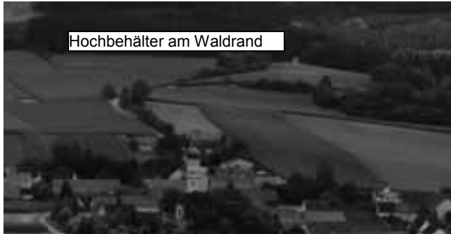
Hochbehälter am Waldrand

Am Dienstag, 15.5.2018, kurz vor Mittag, erteilte das staatliche Gesundheitsamt die Sofortanordnung zum Abkochen des Trinkwassers für die Oberschöneberger Wassergruppe. Mit Unterstützung von Presse und Rundfunk, sowie den Feuerwehren aus den betroffenen Ortsteilen und aus Fischach, Dinkelscherben, Zusmarshausen und Altenmünster startet eine massive Kommunikationsinitiative, um alle betroffenen Haushalte schnellst möglich zu informieren. Besser, schneller und intensiver kann man das wohl kaum machen. Vielen herzlichen Dank allen Helferinnen und Helfern!