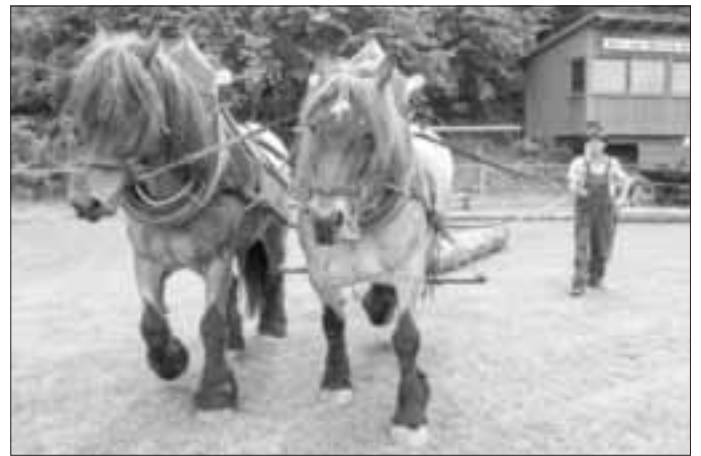
Mächtig ins Zeug legten sich „Nora“ und „Tino“ gelenkt von Günter Drexel

Die Zuschauer des tierischen Vergnügens freuten sich am 10. Mai über ein umfangreiches und abwechslungsreiches Show- und Rahmenprogramm auf das der Reitverein Reischenau e.V. wieder besonders stolz war.