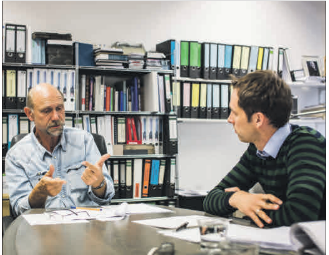
Den Fall besprechen: Neben der fachlichen Qualifikation sollte das persönliche Beratungsgespräch darüber Auskunft geben, ob der ausgewählte Anwalt der richtige ist.

Das sicherste Mittel den richtigen Anwalt zu finden ist und bleibt allerdings das persönliche Gespräch. Hat man einen Anwalt mit