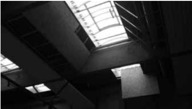
Unterkonstruktion für die neue Hallendecke

Täglich ist unser Bauamt vor Ort. Gerhard Dempfle und Dominik Miller koordinieren zusammen mit dem Bauleiter des Architekturbüros die verschiedenen Gewerke. Auch ein Sicherheits- und Gesundheitsschutzkoordinator (SIGEKO) überwacht die Arbeiten. Die Arbeitsbesprechungen mit den Firmen finden im Physiksaal der Grund- und Mittelschule statt - wenigstens einmal pro Woche und bei unvorhergesehenen Problemen auch öfters.