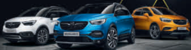
Abb. zeigen Sonderausstattung

BIG DEAL GESCHENKT! 6 Jahre Garantie 3) 3 Inspektionen 4)