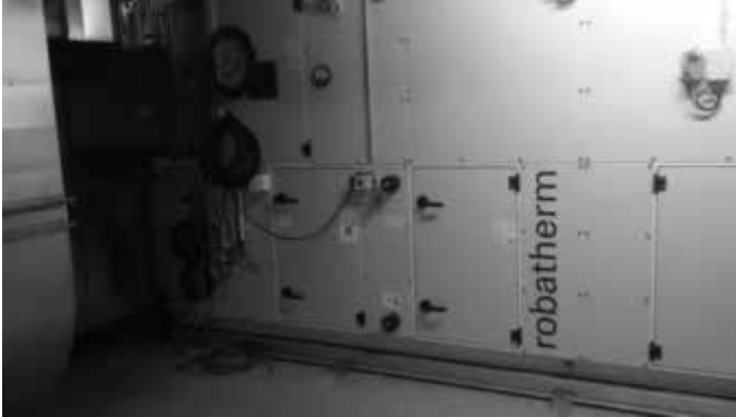
Das neue, energieeffiziente Lüftungsaggregat

Mittlerweile sind fast alle Gewerke für die Sporthalle beauftragt. Zuletzt wurde der neue Hallenboden bestellt. Auch in der Halle schreiten die Arbeiten stetig voran.