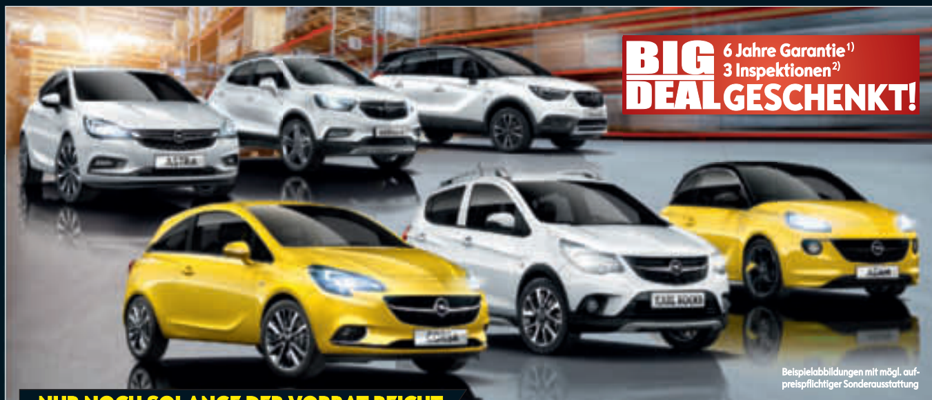
Beispielabbildungen mit mögl. aufpreispflichtiger Sonderausstattung

BIG DEAL GESCHENKT! 6 Jahre Garantie 1) 3 Inspektionen 2)