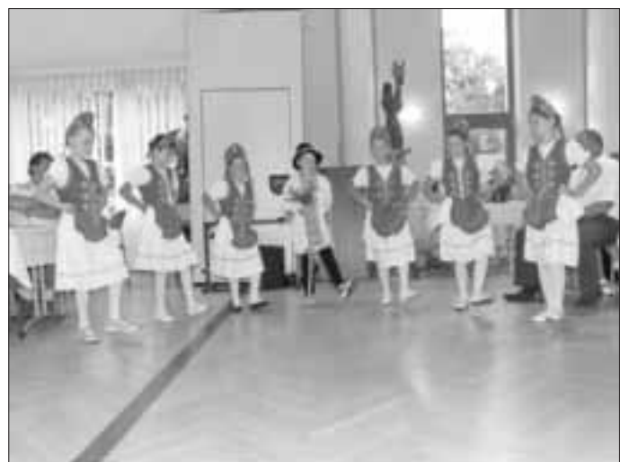
Ungarische Tänze von Dinkelscherbener Kindern getanzt.