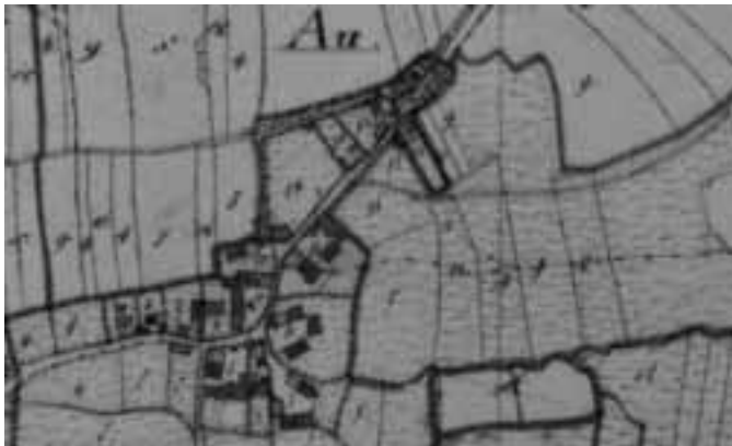
Au um das Jahr 1800

Das Gebäude kommt auf einem schönen Platze in die Mitte des Weilers zu stehen, so daß das Chor östlich, der hintere, westliche Giebel mit dem Eingang aber gegen die Ortsstrasse zu liegen kommt.