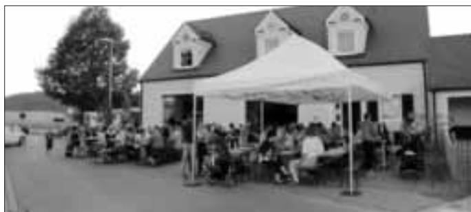
Zahlreiche Besucher beim Dorffest in Lindach

Das Lindacher Dorffest war auch heuer ein voller Erfolg. Am 18. Juli fanden sich bei hervorragendem Sommerwetter zahlreiche Besucher am Feuerwehrgerätehaus in Lindach ein. Trotz weiterer Veranstaltungen im Gemeindegebiet kamen viele Gäste nach Lindach. Da schnell alle vorbereiteten Plätze besetzt waren, mußten wir wieder zusätzliche Tische aufstellen, um allen Gästen einen Platz zu bieten. Für die Kinder war in diesem Jahr eine Hüpfburg aufgebaut worden, die eine hohe Beachtung fand. Während sich die Kinder auf dem Spielplatz und in der Hüpfburg austoben konnten, hatten die größeren Besucher Zeit und Ruhe für den Genuss der leckeren Speisen und Getränke und zu einer zwanglosen Unterhaltung.