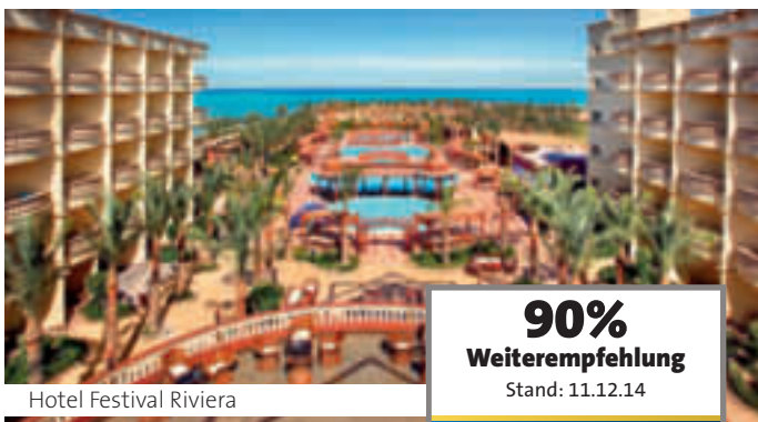
Hotel Festival Riviera