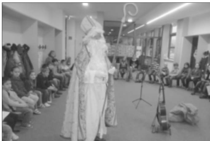
Ein festlich gekleideter Nikolaus besuchte die Schülerinnen und Schüler der Helen- Keller- Schule in Dinkelscherben an seinem Namensfest.

Ein festlich gekleideter Nikolaus mit Bischofsmütze, Stab und Goldenem Buch besuchte die Kinder der Grundschulklassen der Helen- Keller- Schule in Dinkelscherben. Mit Spannung erwarteten ihn die vierzig Schülerinnen und Schüler der ersten bis vierten Klasse in der Aula ihrer Außenklassen an der Mittelschule in Dinkelscherben. „Sei begrüßt lieber Nikolaus, wieder gehst du von Haus zu Haus“ sangen sie ihm zur Begrüßung. Ein Gedicht trugen die Mädchen und Buben der vierten Klasse vor. Der Nikolaus selbst erzählte vom Leben des frommen Mannes, der vor langer Zeit in der Stadt Myra gelebt hat und viel Gutes tat. „Zur Erinnerung feiern wir am 6. Dezember jedes Jahr sein Namensfest und beschenken die Kinder.“ Viel Freude machten dann auch die Säckchen mit Nüssen, Obst und anderen Leckereien, die der Nikolaus verteilte, nachdem er für jede Klasse in seinem Goldenen Buch Lobenswertes vorfand.