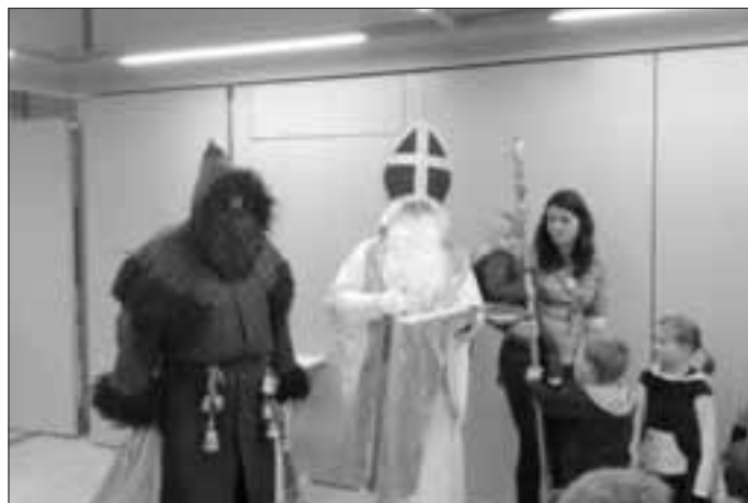
Bildunterschrift: Andächtig lauschten die Kinder dem Bischof Nikolaus, als er seine Geschichte erzählte.

„Von drauß vom Walde komm ich her“ - so hat am vergangenen Freitag im Forum Ustersbach der Bischof Nikolaus den Kindern aus dem katholischen Kindergarten St. Fridolin berichtet. Doch bevor der heilige Mann seine Geschichte erzählte, zeigten die Kinder ihren Eltern und Großeltern, was sie mit dem Kindergarten-Team einstudiert hatten.