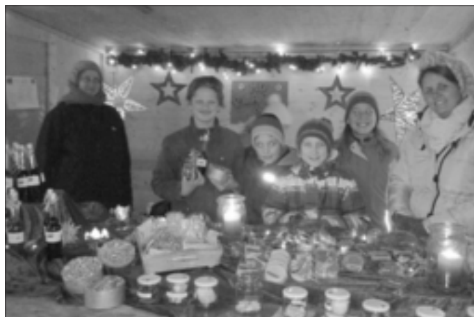
Gute Laune am Verkaufsstand der Montessori Schule Dinkelscherben

Budenzauber, Lichterglanz und vorweihnachtliche Stimmung sorgten vergangenes Wochenende wieder für zahlreiche Besucher auf der Dinkelscherbener Weihnachtsinsel. Auch in diesem Jahr präsentierte sich Montessori Dinkelscherben mit einem Verkaufsstand der Schülerfirmen und dem wunderschönen Märchenzelt. Dank zahlreicher phantasievoller Vorleser sorgten dort einfühlsame Winter- und Weihnachtsgeschichten für jede Menge Spannung und strahlende Kinderaugen.