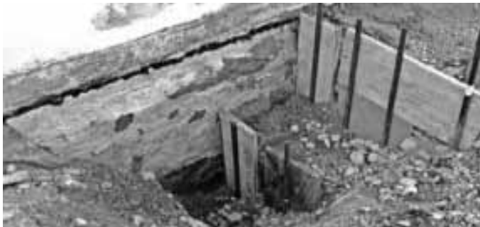
Tonmischung einbringen im Mai 2017

Anschließend wird der östliche Bereich um das Kirchlein neu gepflastert und der Straßenanschluss asphaltiert.