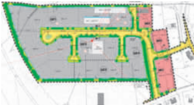
Westlich der Krumbacher Straße, 52.521 m 2

Interessenten für die Flächen bewerben sich bitte im Bauamt bei Frau Gruber, Tel.: 08292/20227 oder per E-Mail: christine.gruber@dinkelscherben.de .