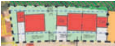
Kellerberg, 3 Plätze, 1.095 m 2 , 175 €/m 2

haben nach ihrer Veröffentlichung nun Rechtskraft. Die Preise für Kellerberg und Weiherfeld wurden vom Marktrat bereits festgesetzt. Für das Gewerbegebiet steht die Festlegung des Verkaufspreises noch aus. Vorher wird die Erschließungsplanung mit einer möglichst genauen Kostenkalkulation gemacht. Angestrebt ist ein Verkaufspreis von 50 - 60 €/m 2 . Alle Preise sind „all inclusive“, das bedeutet inklusive aller Beiträge für Kanal, Wasser, Straße und Ausgleichsflächen.