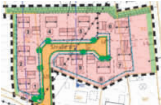
Weiherfeld, 9 Plätze, 5.933 m 2 , 125 €/m 2