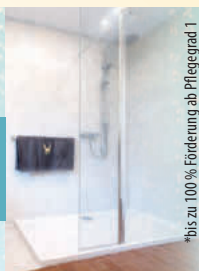
*bis zu 100% Förderung ab Pflegegrad 1

Mehrfach ausgezeichnetes Handwerk | REGIONAL . ZUVERLÄSSIG . ERFAHREN