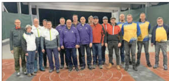
Abschluss des „Training-Cup“ mit den Mannschaften aus Zusmarshausen, Dinkelscherben, Bonstetten und Adelsried am letzten Spieltag auf der Anlage des TSV Dinkelscherben.

Feuchtfröhlich wurde der Abschluss des „Training-Cup“ im Stockschiützenheim gefeiert und man darf sich im kommenden Jahr auf eine Neuauflage freuen.